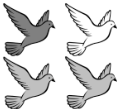
Ownership not specified